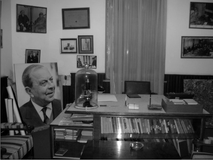
Ek-100 Dr. Fazıl Küçük Müzesi'nde Yer Alan Dr. Fazıl Küçük'ün Çalışma Odası