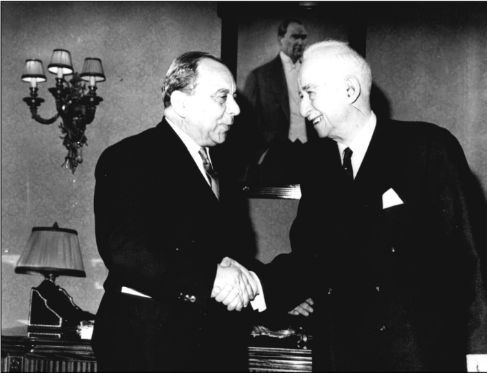
Ek-59 Dr. Fazıl Küçük, İsmet İnönü'yle Birlikte