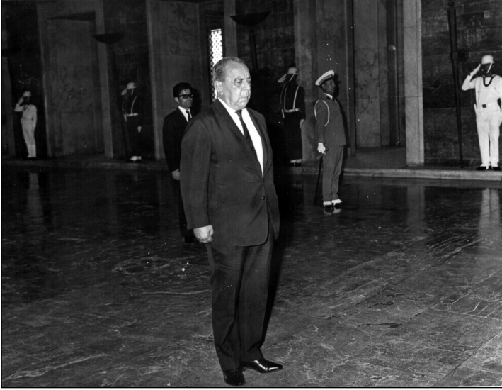
Ek-58 Dr. Fazıl Küçük, Atatürk'ün Huzurunda