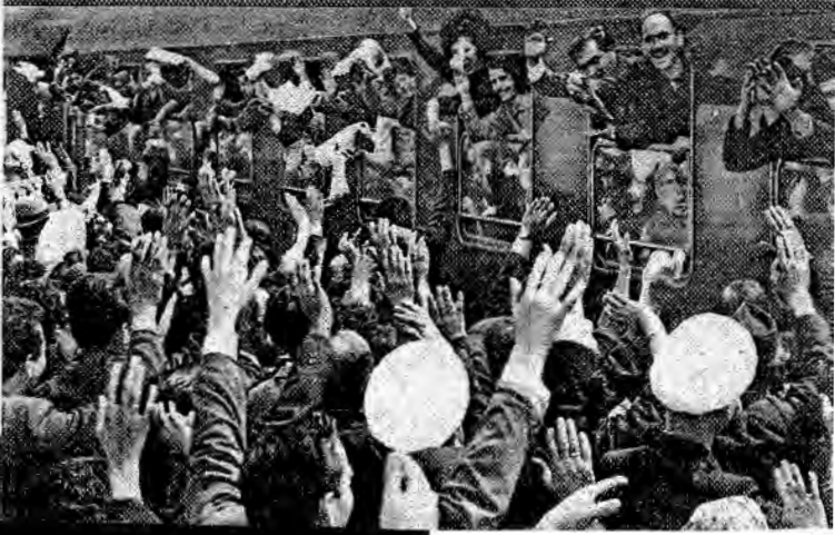
91 a 1961'deki uğurlayış.