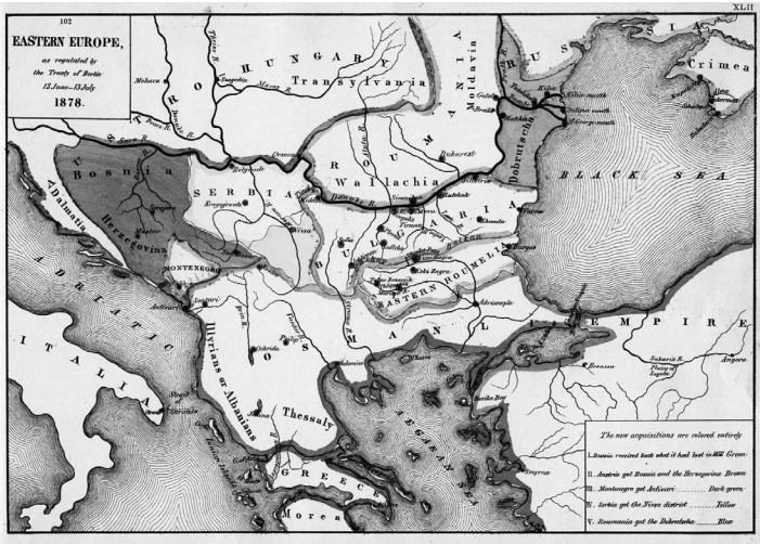
Berlin Kongresi Sırasında Doğu-Batı Sınırları

14. yüzyıldan 20. yüzyılın ilk on yılına kadar süren egemenliği nedeniyle temel bir rol oynadığı coğrafyanın ve tarihin karşılıklı etkileşiminde yatar. Bu dönemde Balkan milliyetçiliği ortaya çıkmış, bu milliyetçi atmosferde doğan Balkan devletleri şimdiki topraklarına yerleşmeye başlamış ve bir türlü tatmin edilmeyen mevcut toprak ihtirasları oluşmuştur. 2