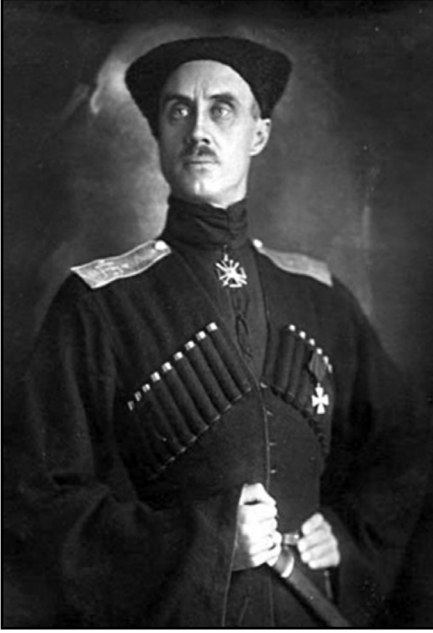
P.N. Vranghel 1878-1928

dı. Bu ordu, (Kafkas Gönüllü Ordusu) Şubat 1919'da Don ordusuyla birleşerek "Güney Rusya Silahlı Kuvvetleri"ni oluşturdu. GRSK'yı General Anton İvanoviç Denikin yönetiyordu. Aynı yılın Mayıs ayında Kafkas Gönüllü Ordusu ikiye bölündü; Kafkas ve Gönüllü orduları. Kafkas ordusu, General Vranghel'in yönetimine girdi.